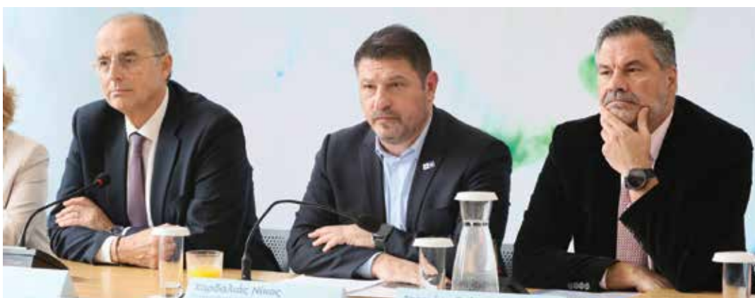
Ο Διευθύνων Σύμβουλος της ΕΥΔΑΠ, Χ. Σαχίνης, ο Περιφερειάρχης Αττικής, Ν. Χαρδαλιάς, και ο Πρόεδρος Διοικητικού Συμβουλίου της ΕΥΔΑΠ, Γ. Στεργίου

Υπενθυμίζεται ότι η ΕΥΔΑΠ κατέχει την 1η θέση μεταξύ 180 χωρών παγκοσμίως ως προς την ποιότητα του νερού, σύμφωνα με τον Δείκτη Περιβαλλοντικής Απόδοσης (EPI) του Yale. Επιπλέον, έχει ένα από τα φθηνότερα νερά στον κόσμο, σύμφωνα με την Global Water Intelligence.