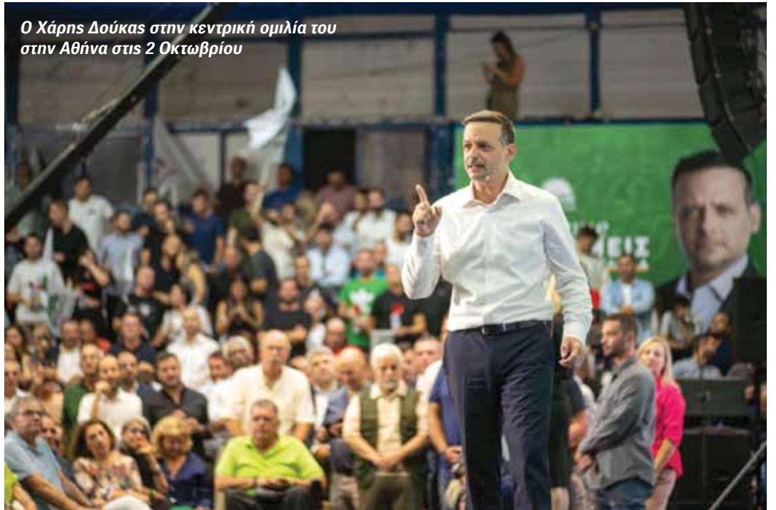
Ο Χάρης Δούκας στην κεντρική ομιλία του στην Αθήνα στις 2 Οκτωβρίου